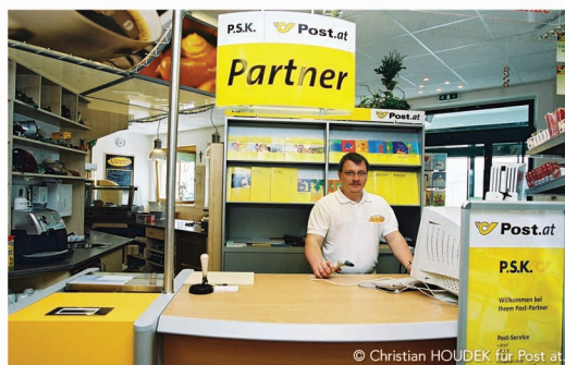
Ausztria: posta és kávézó

A koncepció sikere azon alapszik, hogy postapartnerként minden fél jól jár: a partner új vevőkhöz és nagyobb forgalomhoz jut, az ügyfelek pedig egy helyen, egyidejűleg intézhetik ügyeiket.