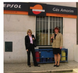
Portugália: Posta gázkereskedelemmel