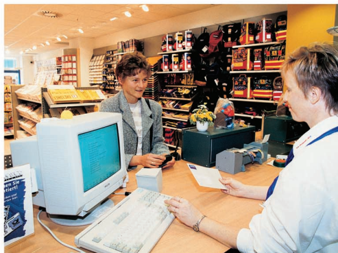
Németország: összeillő profil – posta és papírkereskedés

„Amikor 1996-ban belevágtam a postamesterségbe, kihívásnak tekintettem. Egyáltalán nem volt bennem félsz, éreztem, hogy nem bánom meg a dolgot. Az idő pedig engem igazolt. Családi vállalkozásként működtetjük a három postát, férjem elsősorban a karbantartási munkákért felel. A siker legfőbb zálogának az ügyfelekkel való remek kapcsolatot tekintem. Ha valamelyik nap nem én kézbesítek, másnap már aggódva kérdezzetik tőlem, ugye nem betegség miatt helyettesítettek.