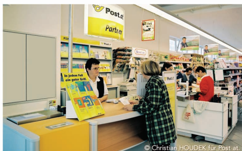
Ausztria: postasarak a szupermarketben

A Magyar Posta Postapartnerai egyúttal részévé válnak a világon egyedülállóan mondható postai hálózatnak. A világot behálózó és embereket összekötő postai szolgáltatás folyamatos és pontos ellátásához több millió ember összehangolt munkája szükséges. Szigorú szabályok, fegyelem, megbízhatóság és rend jellemzi mindezt. Ennek köszönhető az is, hogy az emberek akár a pénzüket is a Postára, a postásra merik bízni – és ez komoly felelősséget jelent. Cserébe társadalmi és üzleti megbecsülés illeti, és bizalom veszi körül mindazokat, akik e szolgáltatást végzik. Legyen szó az egyetemes szolgáltató Magyar Postáról vagy a közreműködő Postapartnerokról.