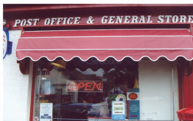
Skócia: Shop-in-shop Bolt a boltban

Az előminősítési hirdetmény és az érintett települések listája letölthető a www.posta.hu/postapartner weboldalon.