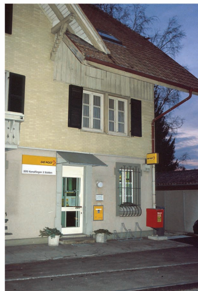
Svájc: családi vállalkozás